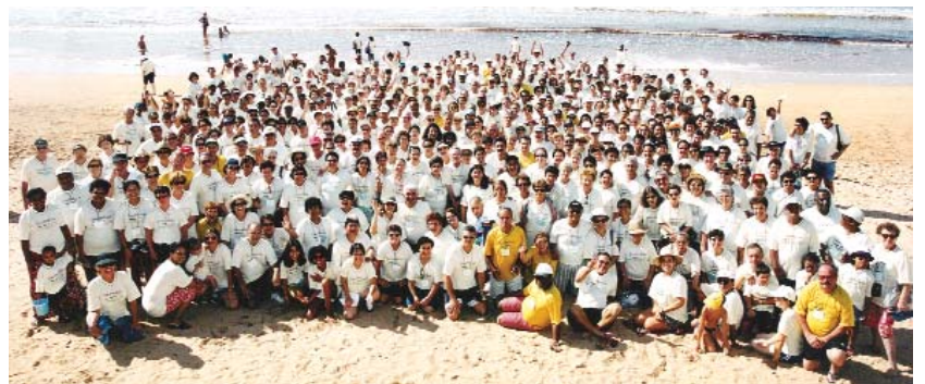
Em 2002, mais de 600 pessoas participaram da 5ª edição do Encontrão

e convidados. Nesses encontros, registramos vários casos de colegas de trabalho que tiveram a oportunidade de se reverem após décadas. Importante ressaltar que a AEA não objetiva lucro com a promoção das viagens. Todo o custo é calculado para que o valor pago pelos associados seja suficiente apenas para quitar as despesas das viagens, tais como transporte, hospedagem, alimentação, guia turístico etc.